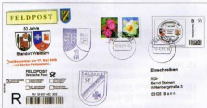
Vom Veranstalter aufgelegter Plusbrief Individuell (am PC bearbeitet) als Einschreiben mit Feldpost-Tagesstempel und zwei Cachets (Bataillonswappen mit „Tatzenkreuz“ in der Wertmarke – unbeanstandet).

Der Feldpostbeauftragte der DPAG, dem solcherlei Umtriebe an den süddeutschen SoFpÄ nicht verborgen geblieben waren, suchte nun im Schulterschluss mit dem Feldpostbeauftragten der Bundeswehr im Streitkräfteunterstützungskommando (SKUKdo) in Köln nach einer praktikablen Lösung. Er erließ am 8. Juni 2009 eine fachliche Weisung „für den Schutz der Persönlichkeitsrechte jedes Feldpostsoldaten“, die in die Befehlsmappe der SoFpÄ aufgenommen wurde. Hierin wurde klargestellt, dass es bei öffentlichen Veranstaltungen, wie Tagen der offenen Tür, nur den zuständigen Sicherheitsoffizieren der Bundeswehr – nicht den Leitern der SoFpÄ – gestattet ist, in besonderen gesperrten Bereichen (zu denen keinesfalls ein SoFpÄ zählt) das Fotografieren zu untersagen. Den Feldpostlern wurde es freigestellt, bei diesen Veranstaltungen auf ihren Uniformen Namensbänder sichtbar zu tragen. Und schließlich sollten Feldpostsoldaten, die nicht im Zuge der Berichterstattung über ihre Tätigkeit bei einem Sonderfeldpostamt abgelichtet und/oder namentlich benannt werden woll(t)en, nach Möglichkeit nicht mehr zu einer solchen Wehrübung (bei einem SoFpÄ) herangezogen werden. Mit dieser, auch mit dem Datenschutzbeauftragten des SKUKdo abgestimmten Regelung hätte die Feldpostwelt auch für den Besucher mit Fotoapparat wieder in Ordnung sein sollen. Doch es kam anders!