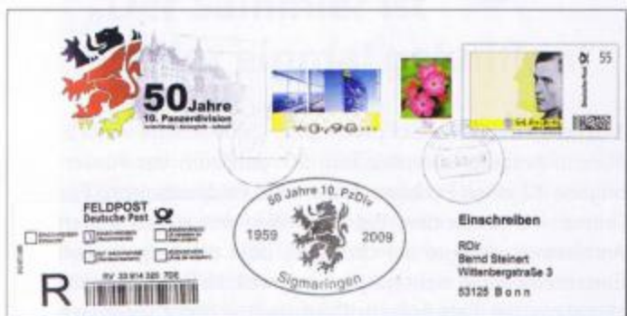
Vom Veranstalter aufgelegter Plusbrief Individuell als Einschreiben mit schwachem Feldpost-Tagesstempel und Cachet der Veranstaltung.

nat mit dem Feldpostbeauftragten der Feldpost Bonn aufgenommen. All diese Unzulänglichkeiten boten Chronisten Anlass, in ihren Berichten mit „Chaos in Amberg?“ und „Desorientierte Soldaten“ zu titeln. Auch die Hoffnung des Autors, bei den Vorgängen in Amberg habe es sich lediglich um „Startschwierigkeiten“ gehandelt, erfüllte sich leider nicht.