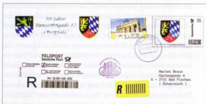
Privater Plusbrief Individuell des Briefmarkensammlervereins Amberg als Einschreiben ins Ausland (I) mit schwachem Feldpost- und Cachetstempel.

1– Gleich das erste SoFpÄ im Jahr 2009 lieferte am 15. März in Amberg/Oberpfalz zum 50. Jubiläum der Panzerbrigade 12 einen Fehlstart in die neue Feldpostsaison. Für Unmut – insbesondere bei Sammlern mit einem weiten Anreiseweg – sorgte der Umstand, dass die Aufgabe von Einschreibbriefen nicht möglich war, weil die Feldpostler die Mitnahme der Labelrolle in Darmstadt schlicht vergessen hatten. Man behalf sich schließlich mit dem Angebot, die Einschreiben sowie einen offenen, bereits voradressierten Brief anzunehmen und in der Feldpostleitstelle in Darmstadt nachträglich zu bearbeiten und den Einlieferungsbeleg von dort zuzusenden. Hierbei soll es dann zu Verwechslungen gekommen sein. Weiteren Ärger verursachte die Weigerung der Feldpostler, private Plusbriefe mit dem Wappen der Feldpost neben der Wertmarke zu bearbeiten.